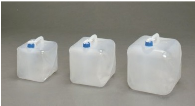
ウォーターキャリア

そこで 10 リットルのものを 2 つ用意される事をお勧めします。このキャリアは折りたたんで保管し、使用する時は、横に寝かして使います。