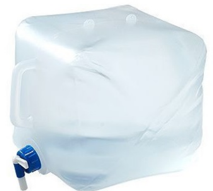
使用する時は寝かして使います